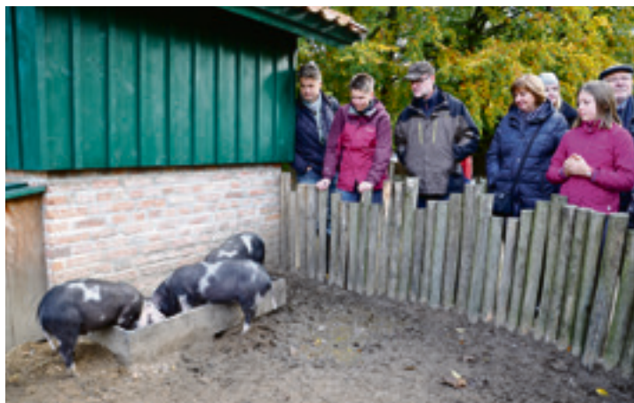
Die seltenen Schwedischen Linderöd-Ferkel sorgten für großes Aufsehen unter den KN-Abonnenten.